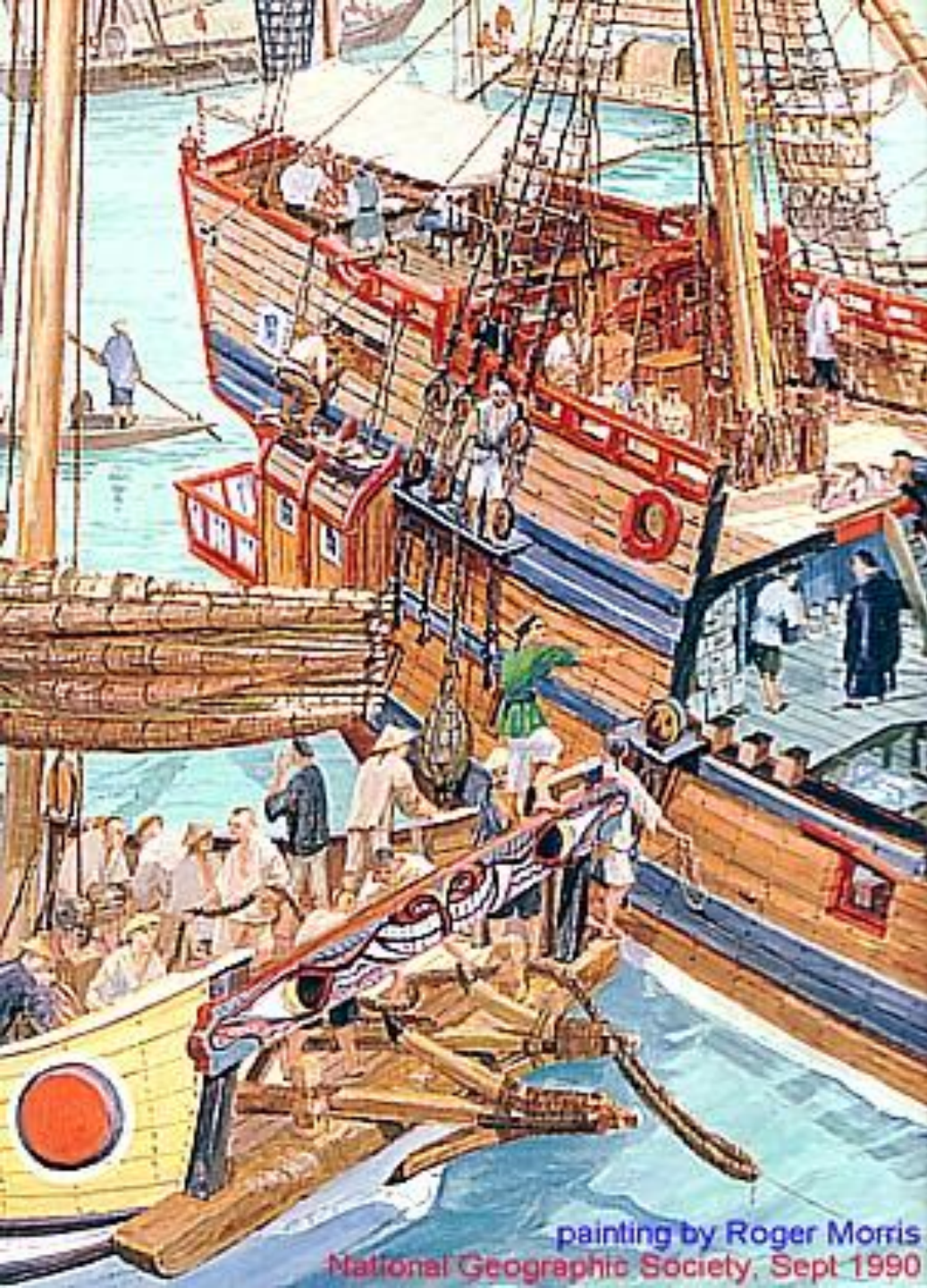
painting by Roger Morris National Geographic Society, Sept 1990