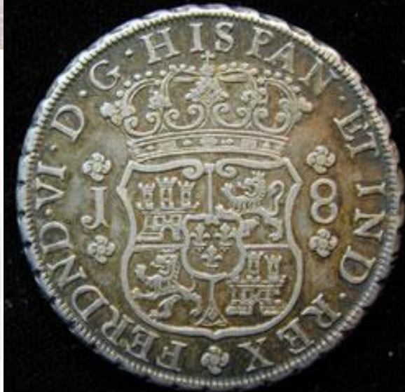
1753 PERU 8 REALES PILLAR TYPE